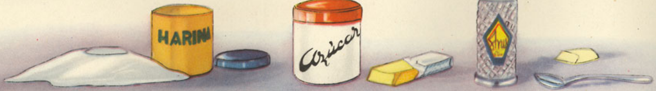
100 gramos harina