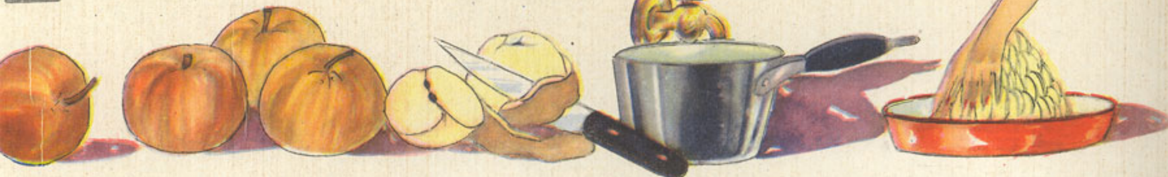
medio kilo manzanas