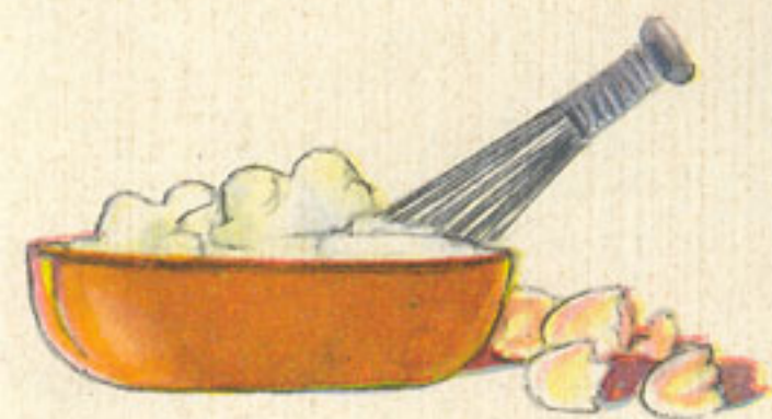
batido claras a punto de nieve