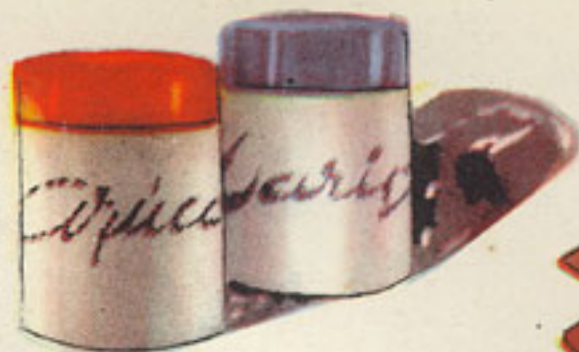
125 gramos azúcar