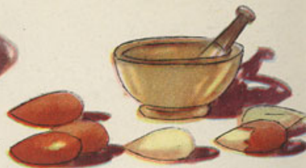
50 gramos almendras