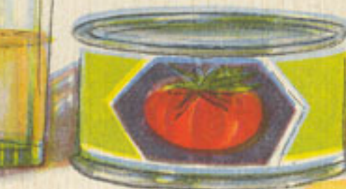
lata de tomate