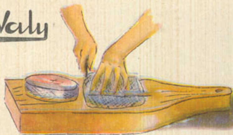
corte de la merluza