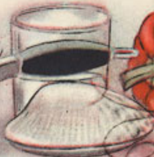
50 gramos de almejas