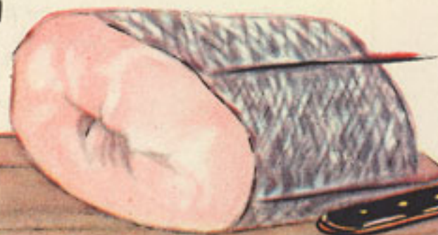
medio kilo merluza