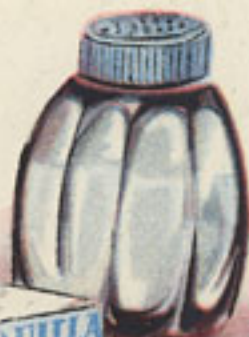
1 pellizco pimienta blanca