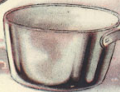
medio vaso agua