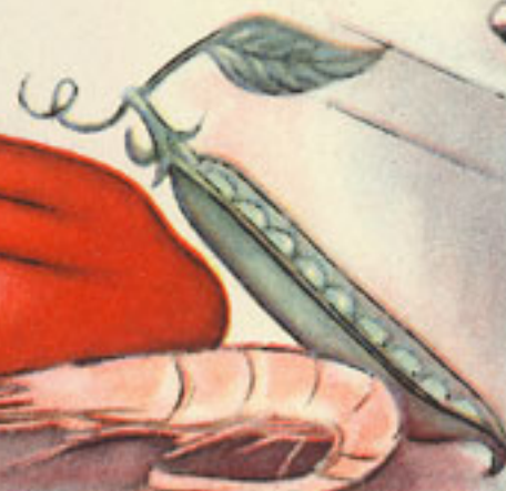
3 cucharadas guisantes