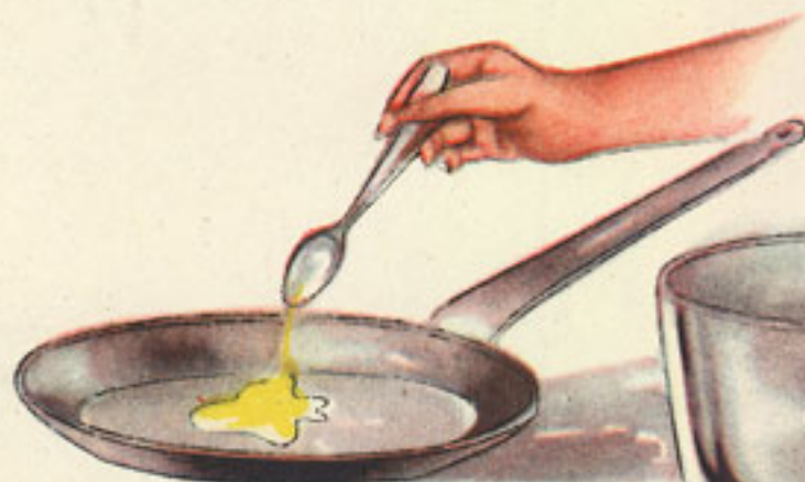
2 cucharadas aceite