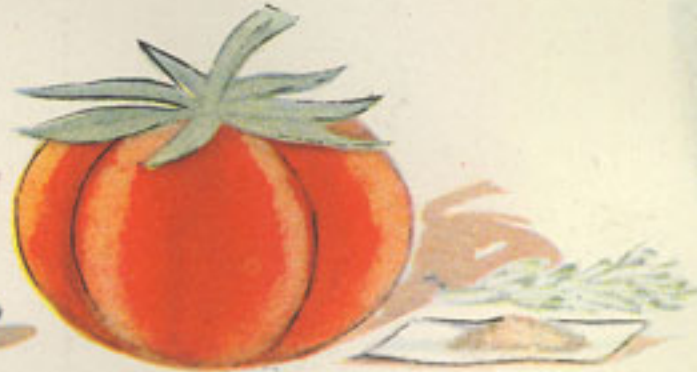
6 cucharadas salsa de tomate