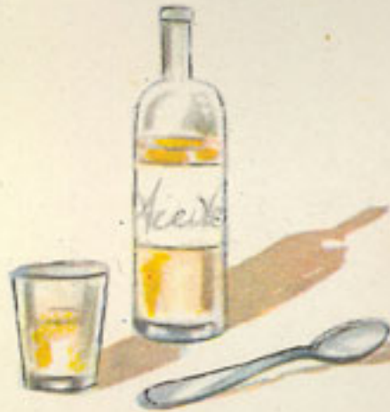
medio vasito vino blanco 1 cucharada aceite