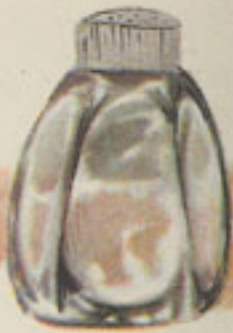
pimienta en polvo