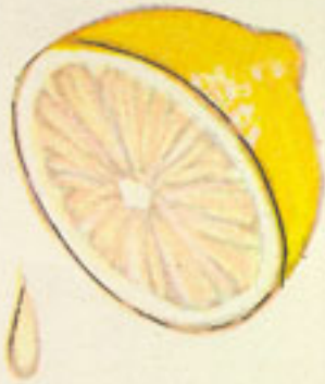
jugo medio limón