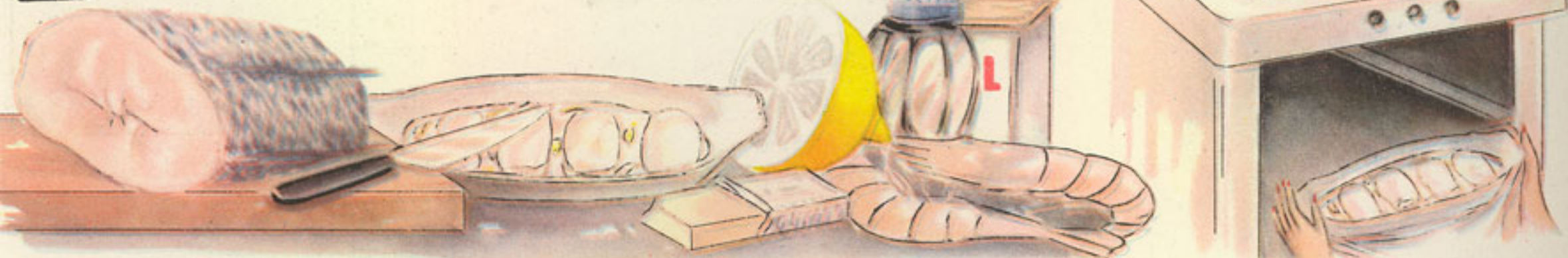
medio kilo merluza