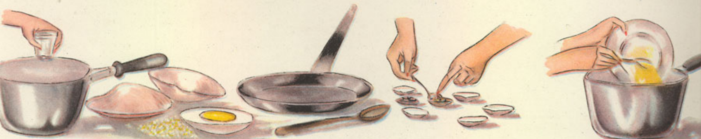
1 vaso de agua almejas huevo duro picado