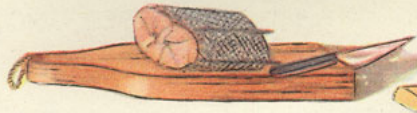
4 ruedas merluza