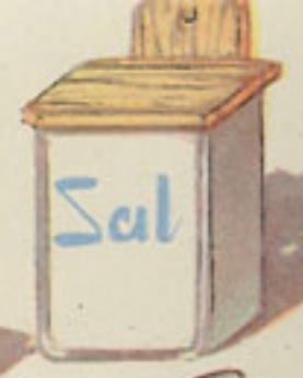
sal medio vasito vino blan