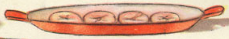
colocación de la merluza