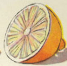
jugo medio limón