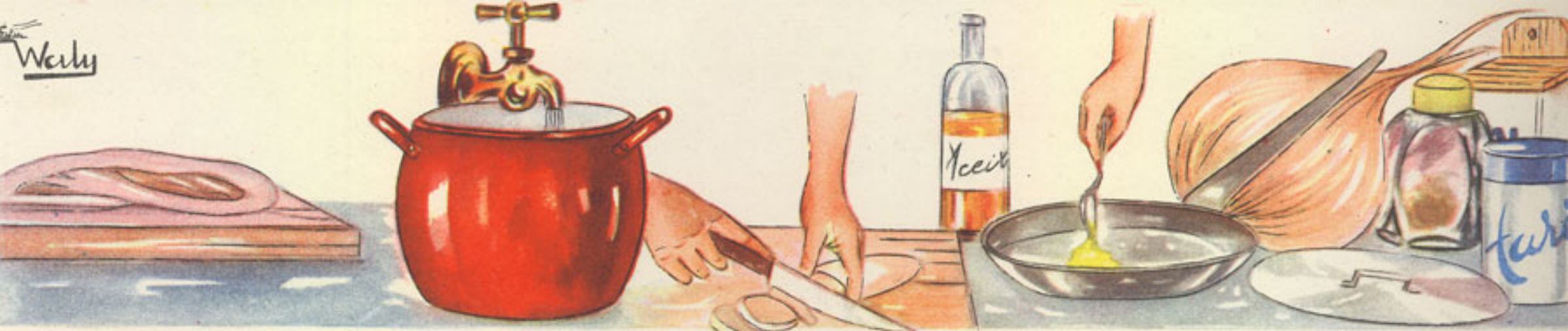
750 grs. carne de morcillo