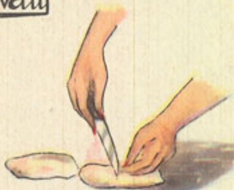
medio kilo mollejas de ternera